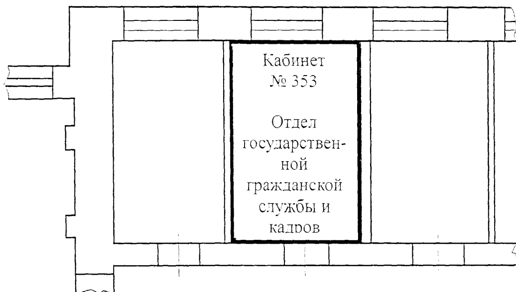
Кабинет № 353